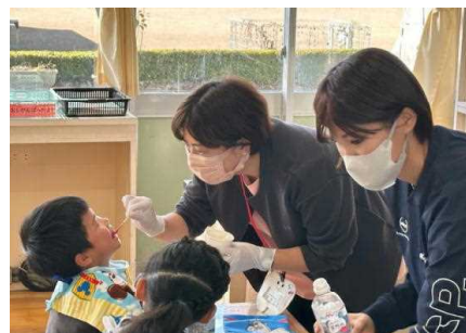
(2年生：歯みがき指導)

4・6年生を対象に「歯みがき指導」を実施しました。始めに、虫歯のでき方や虫歯の防ぎ方についてお話を聞かせていただきました。最後に、歯みがき指導もお世話になりました。一人一人歯ブラシの持ち方や動かし方などを見ていただき、鏡を見ながら確認することができました。ご家庭でも歯みがきの様子など見守っていただければと思います。