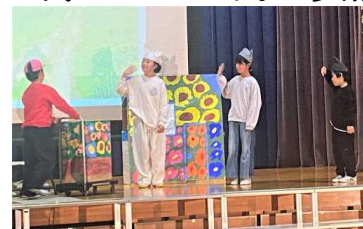
(5年：3びきのかわいいオオカミ)