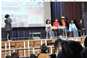
(4年：みなみんニュース)